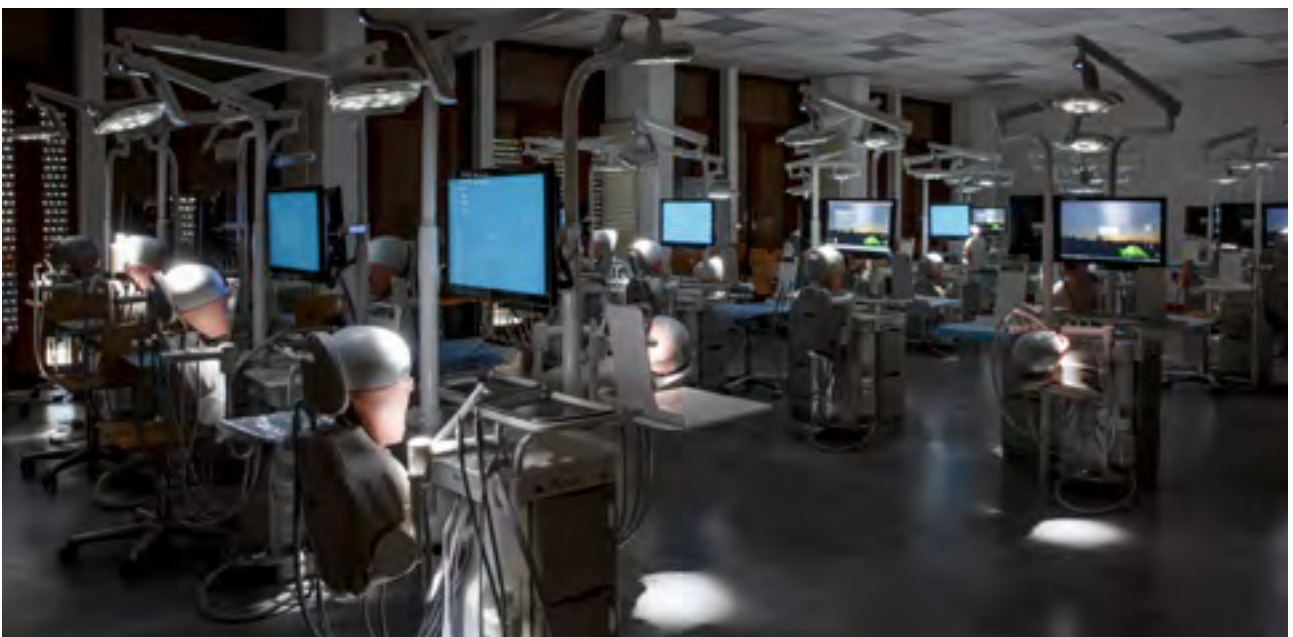
Plateforme de simulation en odontologie.