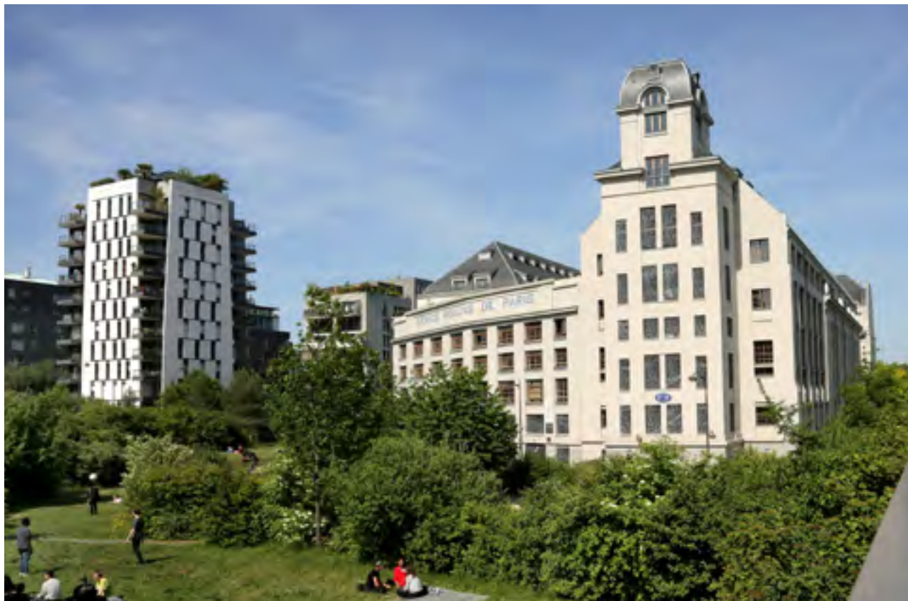
Jardin de l'Abbé Pierre sur le campus des Grands Moulins dans le 13 e arrondissement.