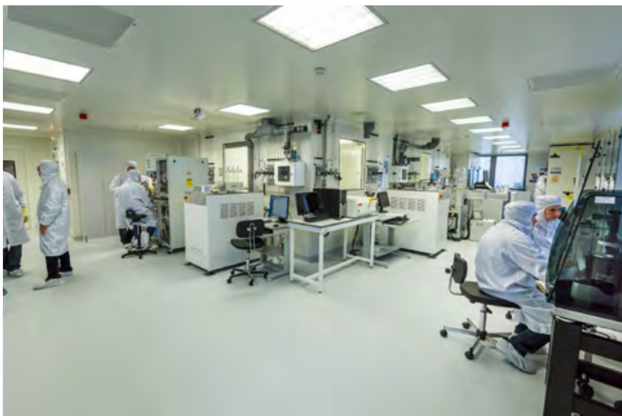
Le soutien aux plateformes et équipements scientifiques est une priorité. La salle blanche - Faculté des sciences - UFR physique.

Enfin, nous développerons les initiatives en faveur de la science ouverte d'une part (en déployant les infrastructures permettant la publication des données et résultats de recherche, mais aussi en soutenant les initiatives de sciences participative et médiation scientifique), en faveur de l'éthique et de l'intégrité scientifique d'autre part.