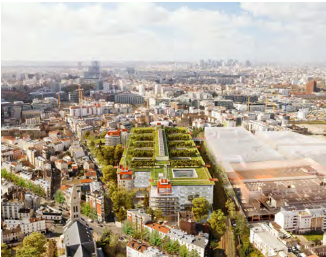
Le campus hospitalo-universitaire Saint-Ouen Grand Paris Nord ouvrira ses portes à l'horizon 2028.