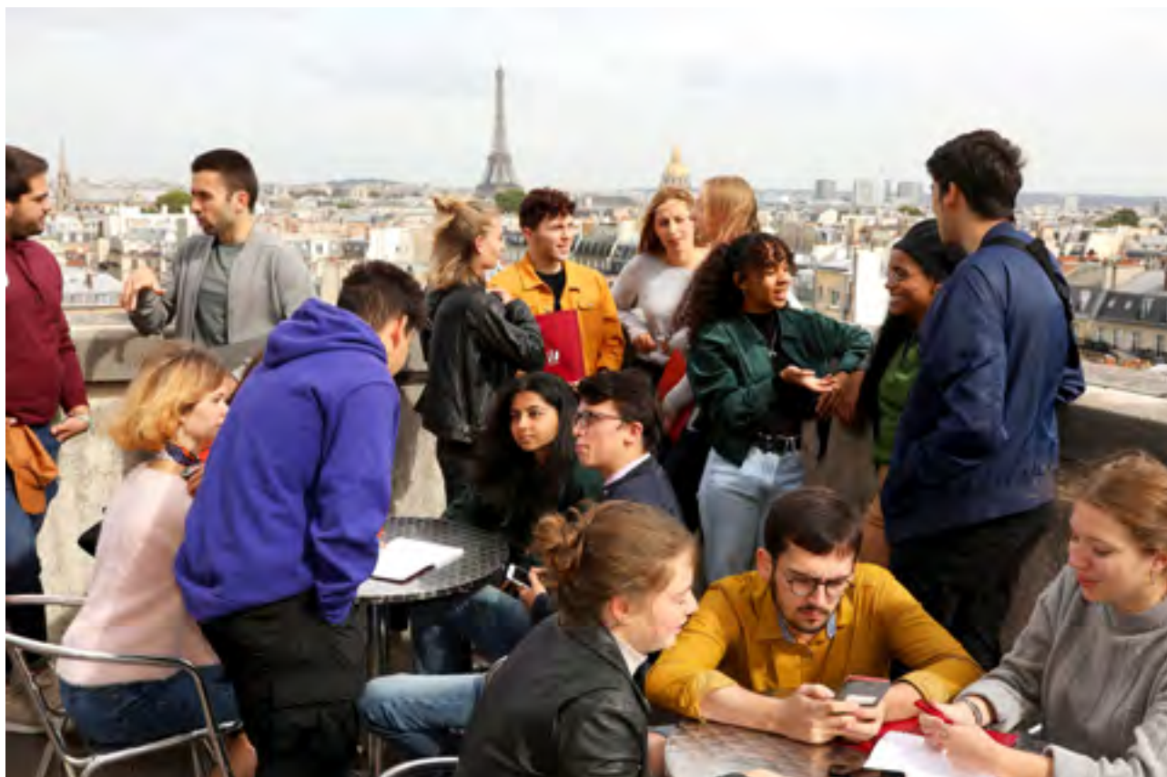
Université Paris Cité c'est plus 500 000 m 2 de de campus dans Paris intramuros et sa proche couronne.