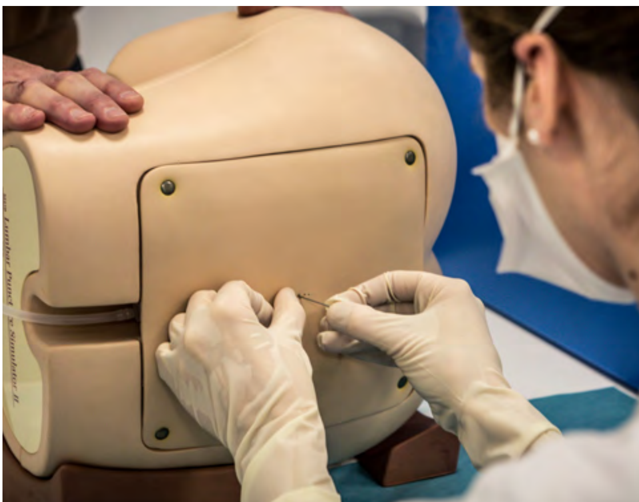
La plateforme de simulation en santé iLumens : l'exemple d'un dispositif de pédagogie innovante associant de nombreux partenaires.

Faire évoluer les outils de gestion, systèmes d'information, et outils de suivi doit faciliter le suivi des étudiantes au service de leur réussite : mise en place systématique des contrats pédagogiques, suivi statistique de la réussite des étudiantes et des étudiants, suivi de leur poursuite d'études et insertion professionnelle, poursuite du déploiement du e-portfolio actuellement mise en place pour les étudiantes et étudiants en santé.