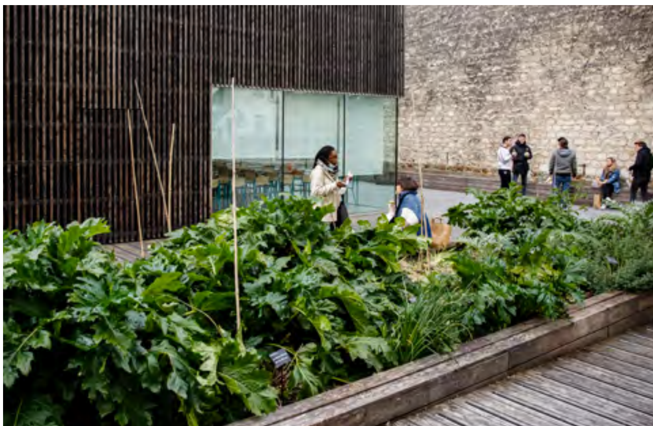
Jardin partagé, projet intitulé « Retour de la Terre » et créé, dans le cadre du 1% artistique, par l'architecte-paysagiste Emmanuelle Bouffé sur le campus de l'IUT Paris Rives de Seine.

À cet égard, nous mettons en œuvre un plan d'action pour élargir et renforcer les contacts avec ces institutions situées à Paris et sa région, mais nous appuierons également sur nos partenaires internationaux - par exemple au sein de Circle U., ou une des actions aborde spécifiquement l'entrepreneuriat, y compris des femmes, en interaction avec la ville et nos acteurs de santé.